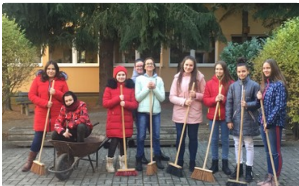
Obr. č. 3 Kolégium Zelenej školy