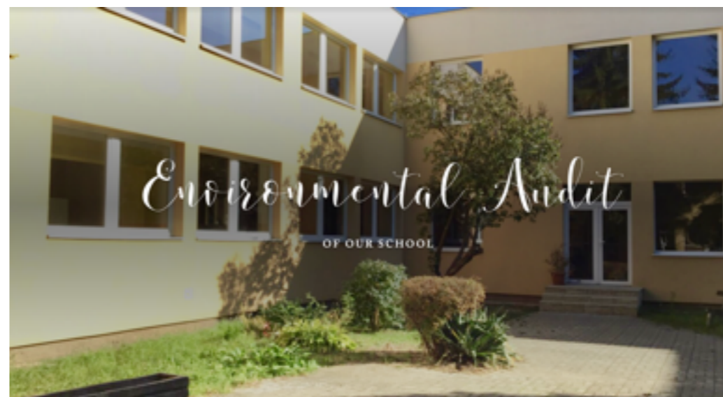
Environmentálny audit školy